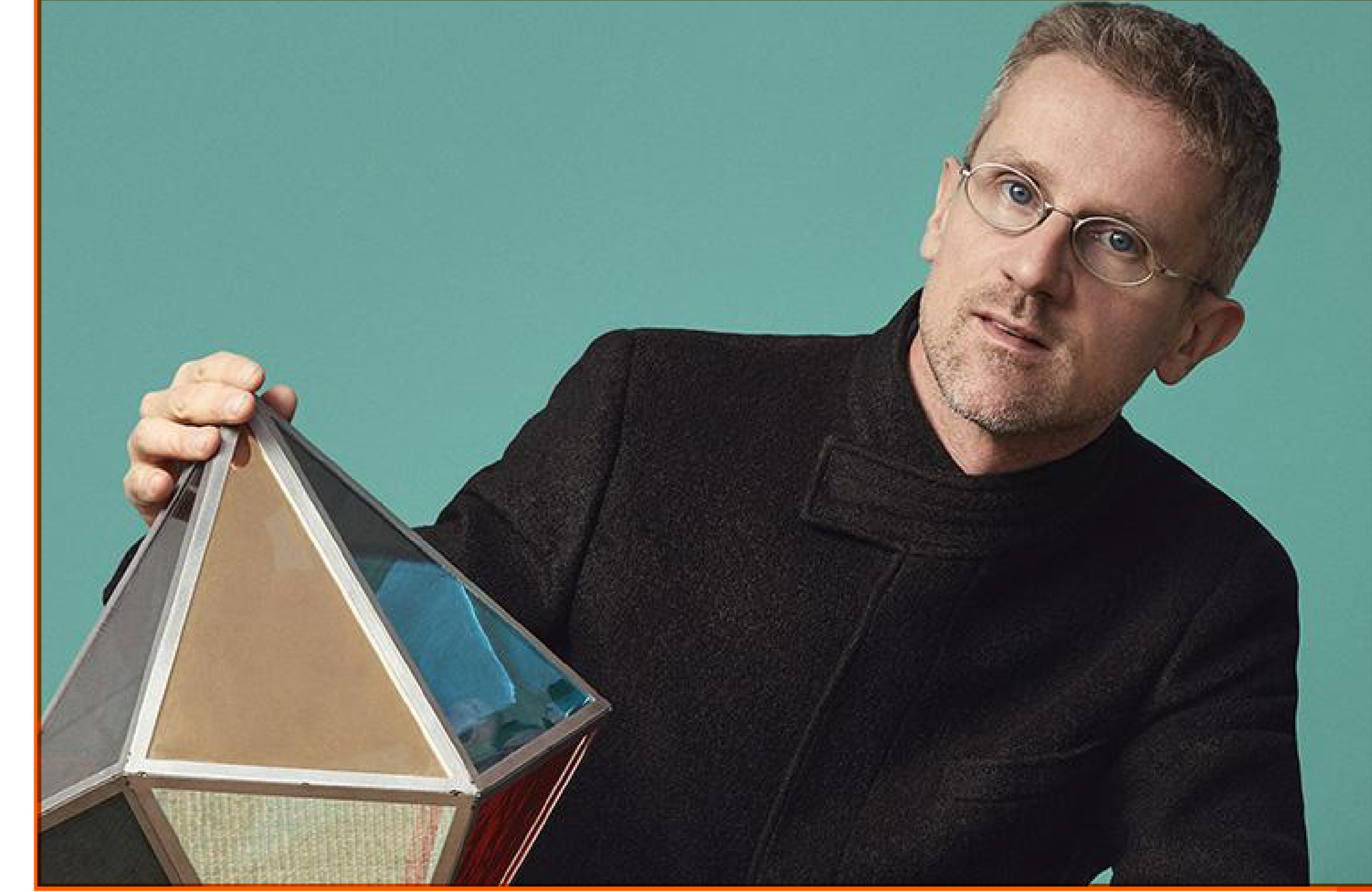
KÜRATÖR: CARLO RATTI