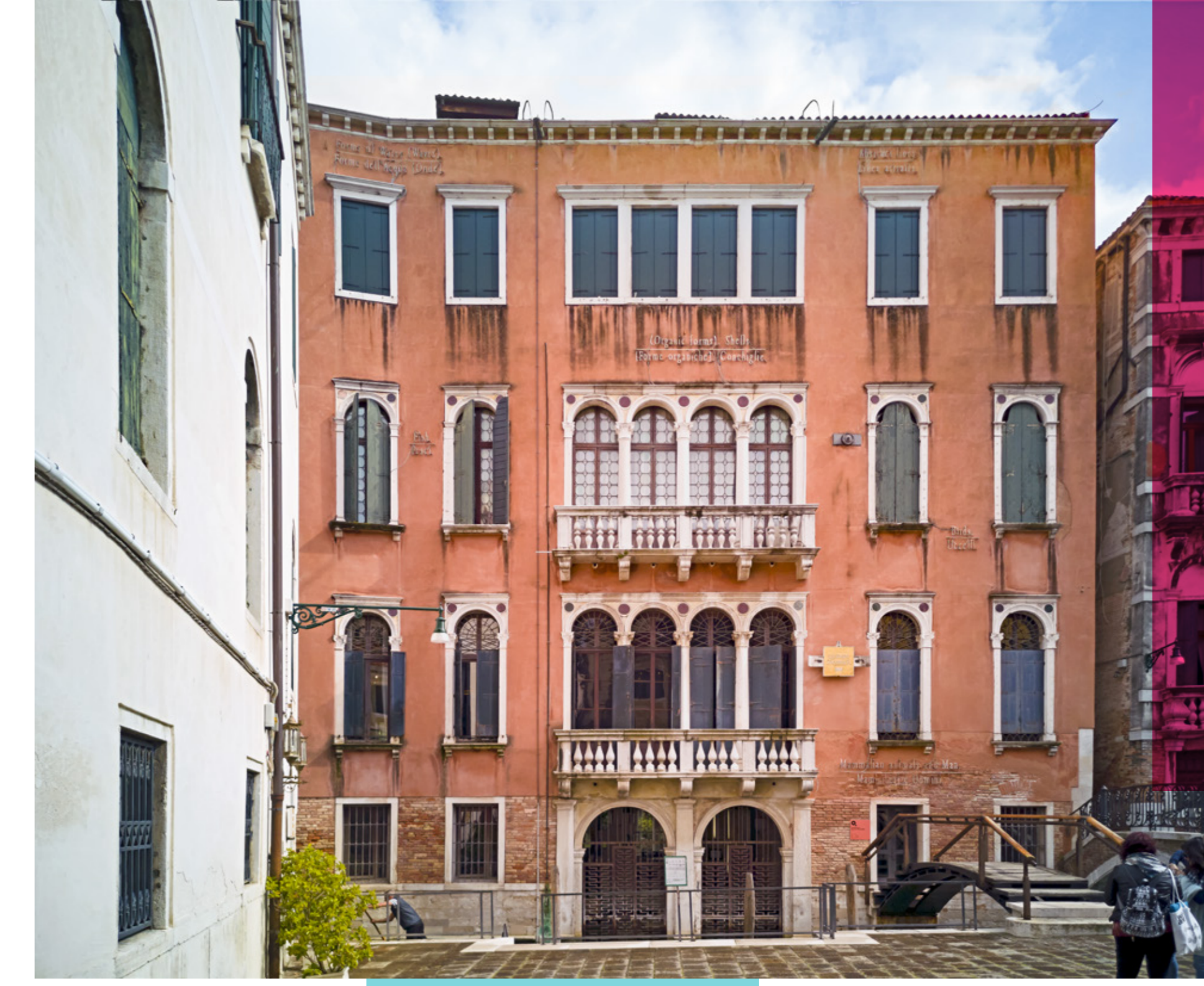
FONDAZIONE QUERINI STAMPALIA

Fondazione dell'Albero d'Oro'nun ziyaret saatleri dışında gruba özel rehber eşliğinde güncel sergi ve mekân turu.