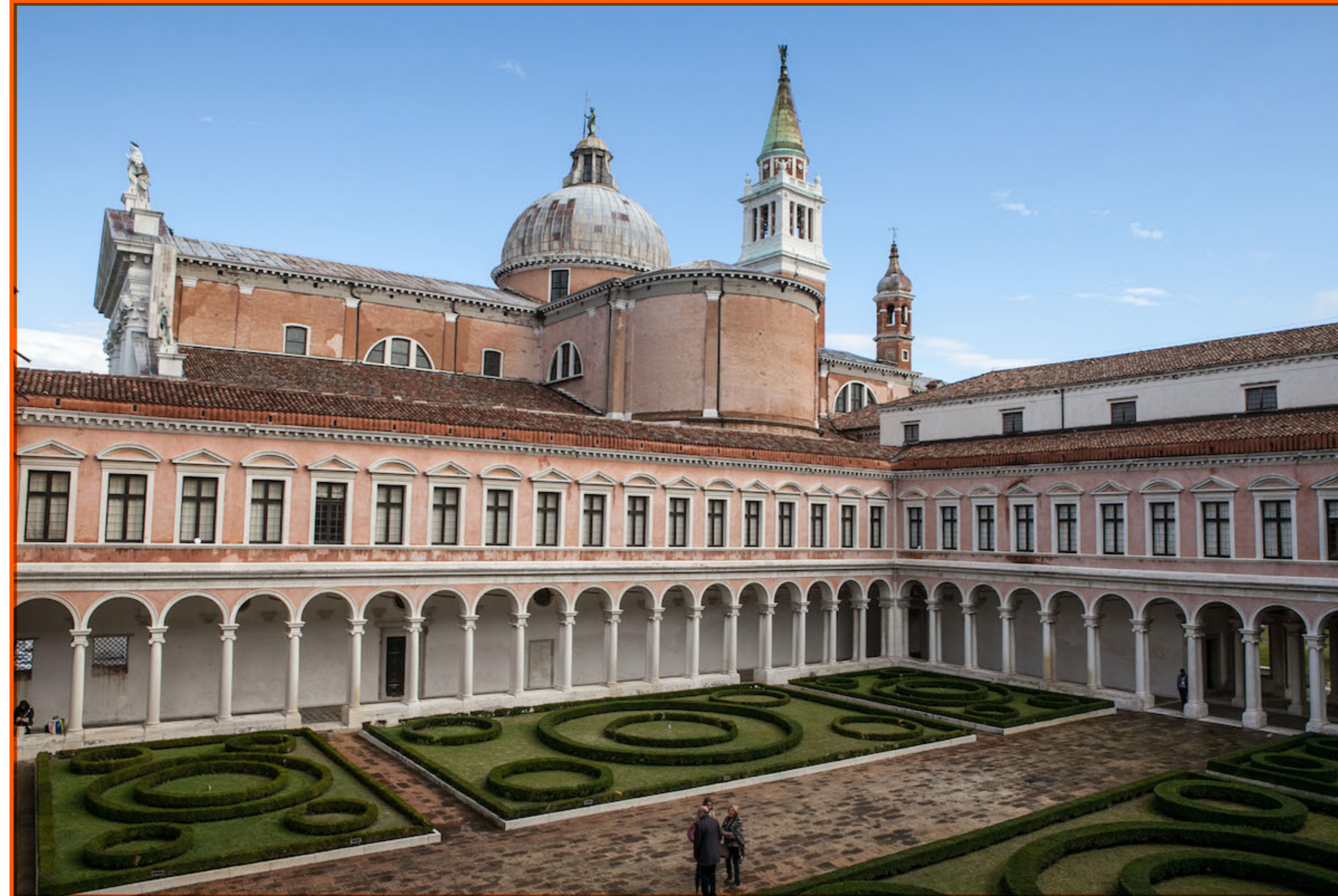
FONDAZIONE GIORGIO CINI