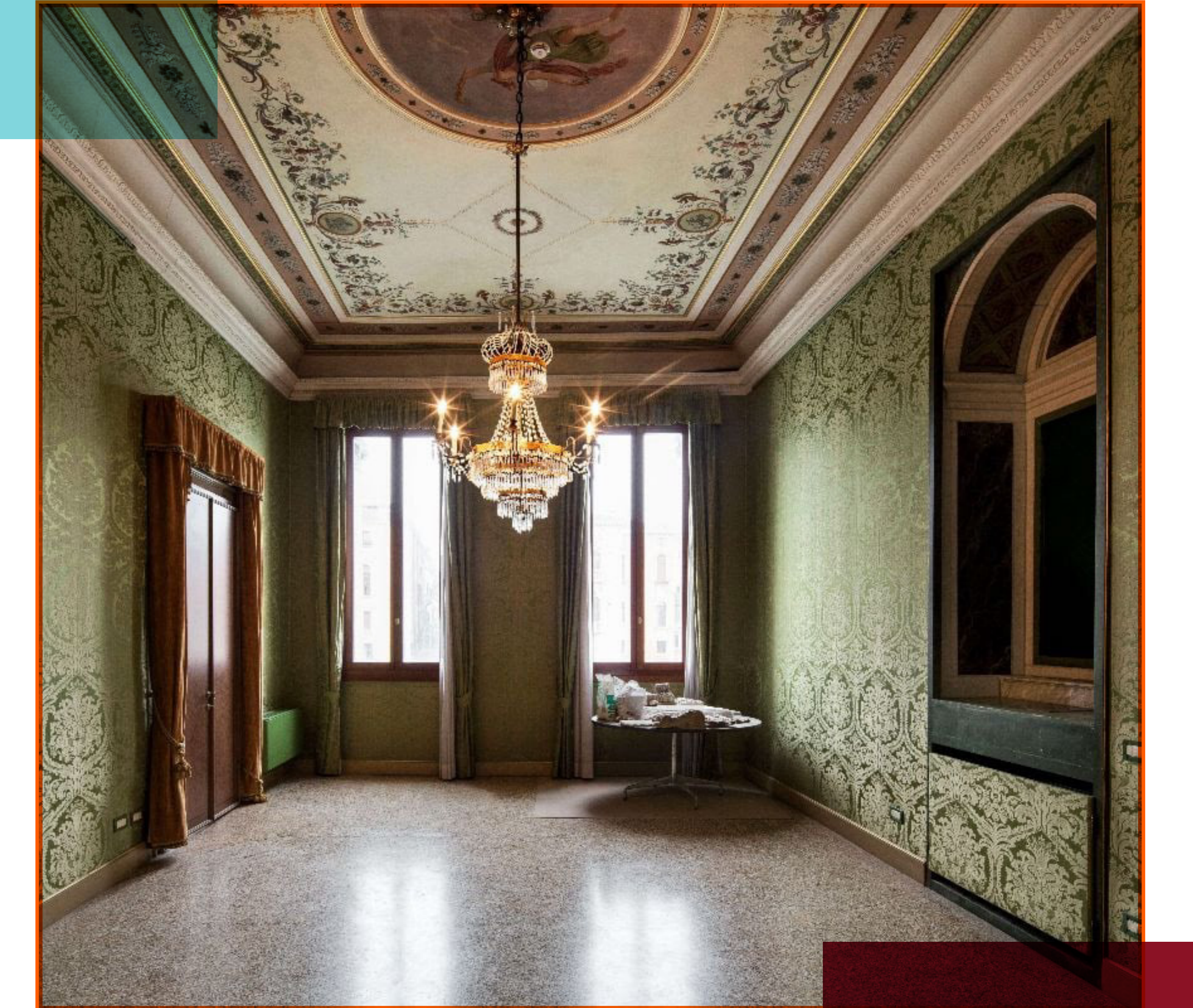
FONDAZIONE DELL'ALBERO D'ORO